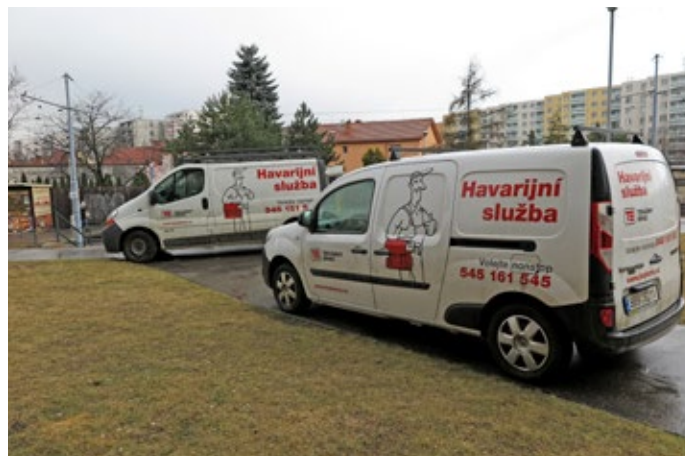
Vozidla HS při výjezdu Brno – Starý Lískovec