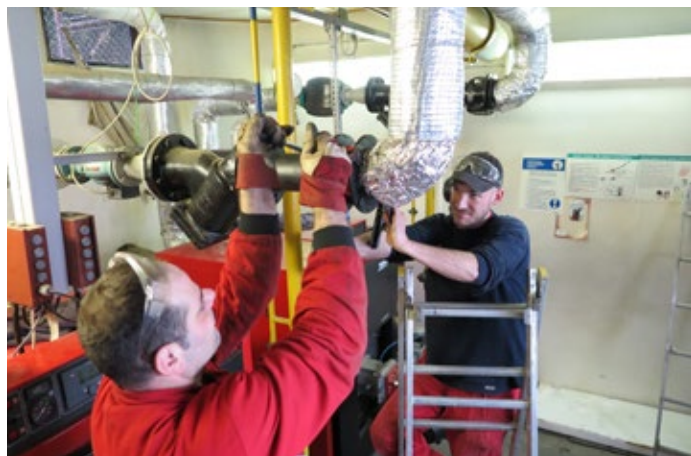
Pracovníci odboru oprav a údržby při výměně mezipřírubové klapky

Pro více informací o poskytovaných službách nebo o uzavření kupní smlouvy kontaktujte pana Martina Brůna na 545 169 288, bruna@teplarny.cz .