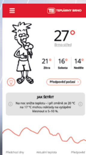
Předpověď počasí na 3 dny

Získejte přehled o počasí, teplotách a odstávkách. Stahujte zdarma pro mobilní zařízení se systémem iOS i Android.