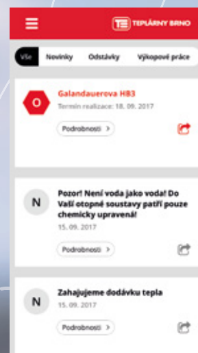
Odstávky, výkopy, havárie a spousta dalších funkcí